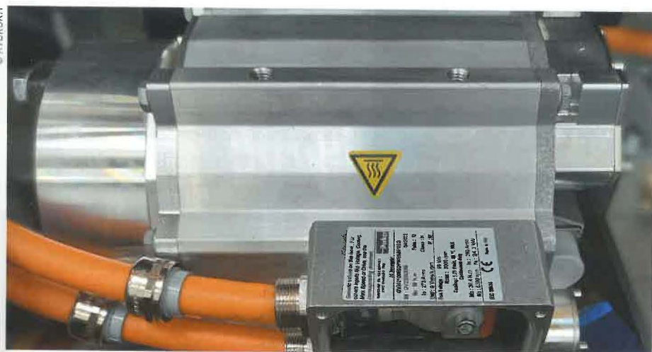
La profondeur des gammes Parker et leur notoriété pourvoient aux solutions d'électrification.

s'appuyant sur l'exemple européen, donc avec une énergie électrique décarbonée. L'électrification, dans l'écosystème Hydrokit - Parker Hannifin - Forsee, touche principalement les engins off road de moins de 50 chevaux. Dans ce cas, elle permet de diviser par deux les émissions de CO 2 . Ce retrofit répond non seulement aux fortes contraintes réglementaires et environnementales en termes d'émission, mais aussi de bruit, l'une des premières nuisances en ville. L'électrification des engins off road s'appuie sur la directive machines de 2008. À partir de 2027, la réglementation machines (non contraignante)