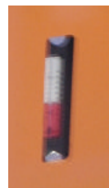
Niveau d'huile hydraulique