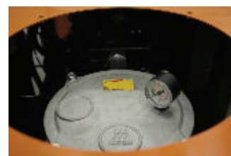
Filtre retour avec indicateur de colmatage