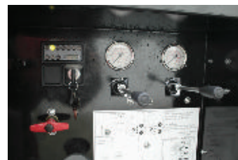
Poste de commande