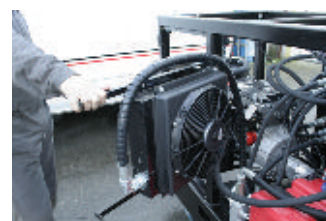
Accès simplifié pour intervention