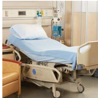
SOINS DE SANTÉ