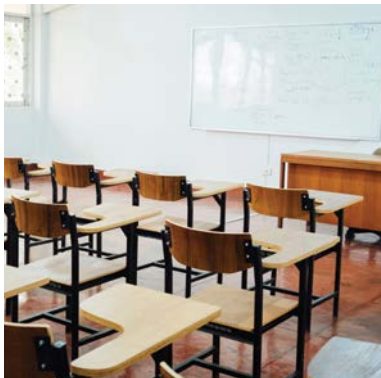
LOGEMENT ET ÉDUCATION