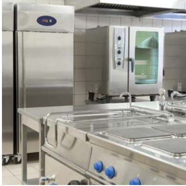
SERVICES DE RESTAURATION